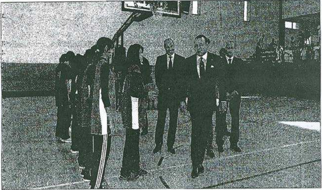
العاهل المغربي لدى إطلاقه مشروعاً رياضياً في مراكش أمس